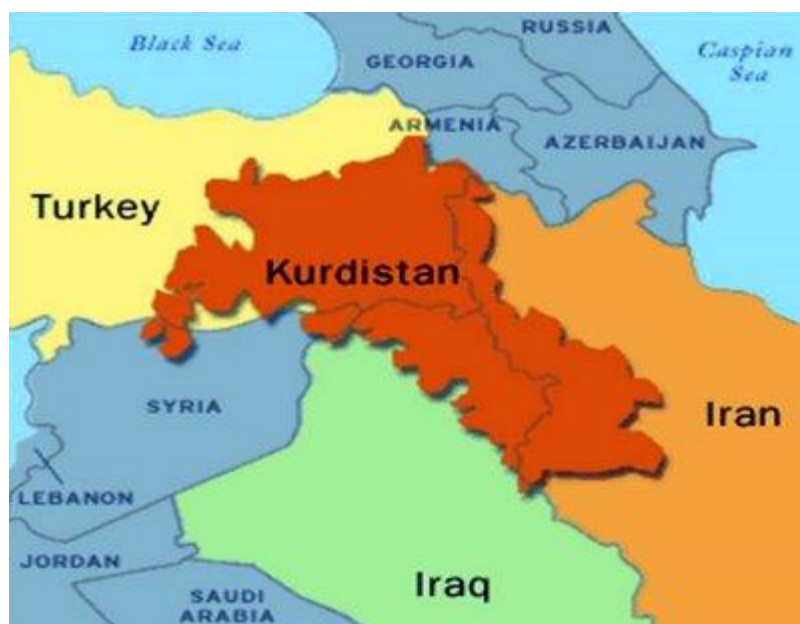
Obrázek č. 10: Mapa Turecka