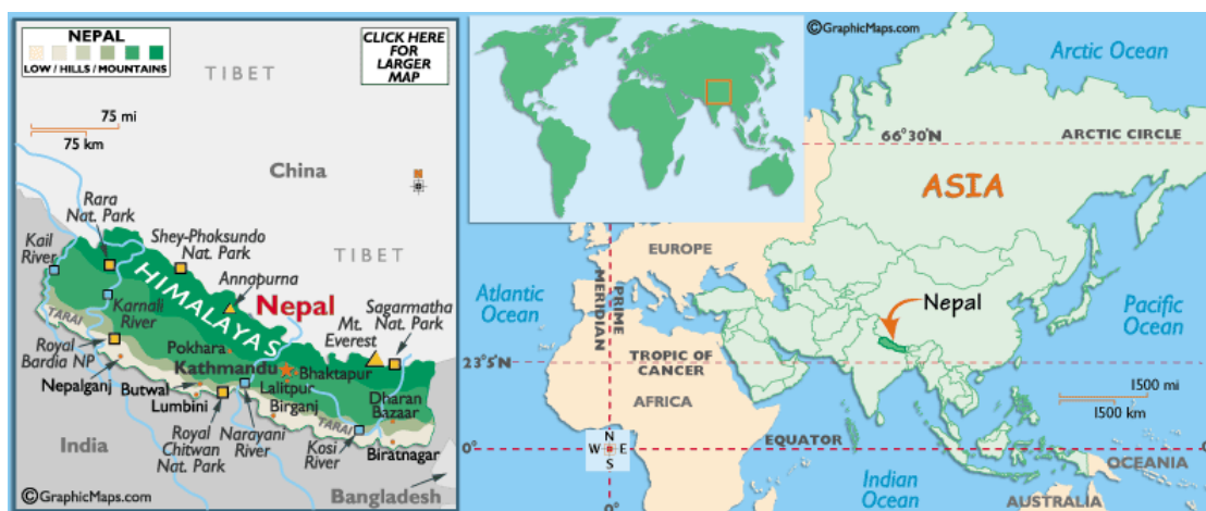
Obrázek č. 3: Mapa Nepálu