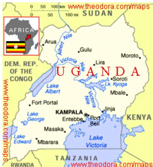
Obrázek č. 7: Mapa Ugandy