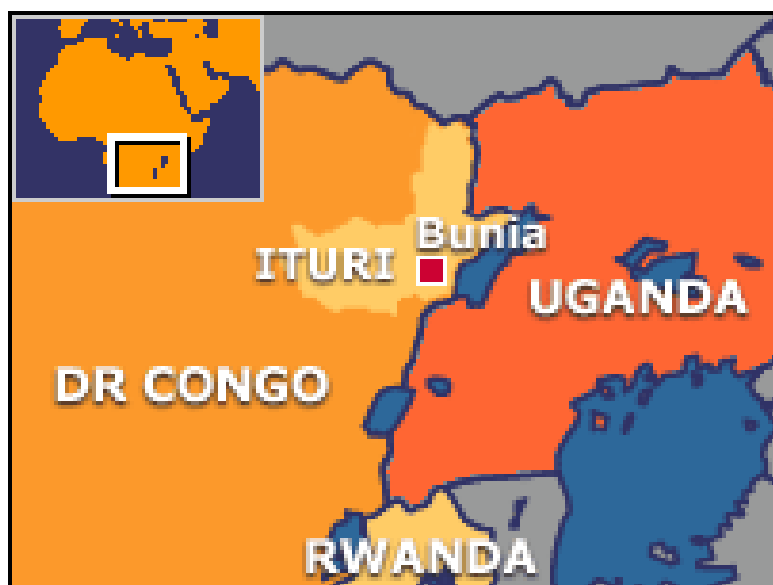
Obrázek č. 13: Mapa Konga a provincie Ituri