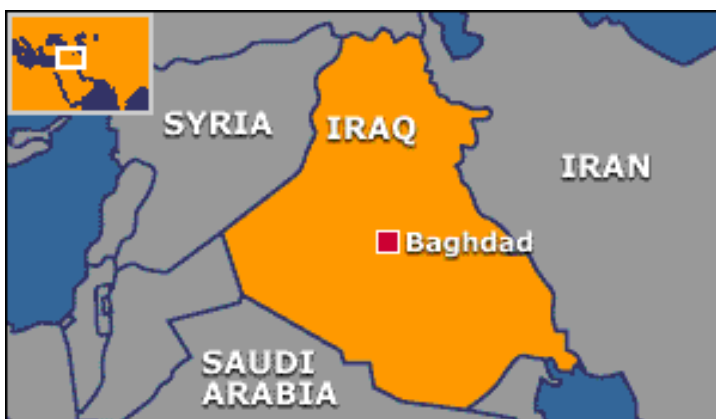
Obrázek č. 4: Mapa Iráku