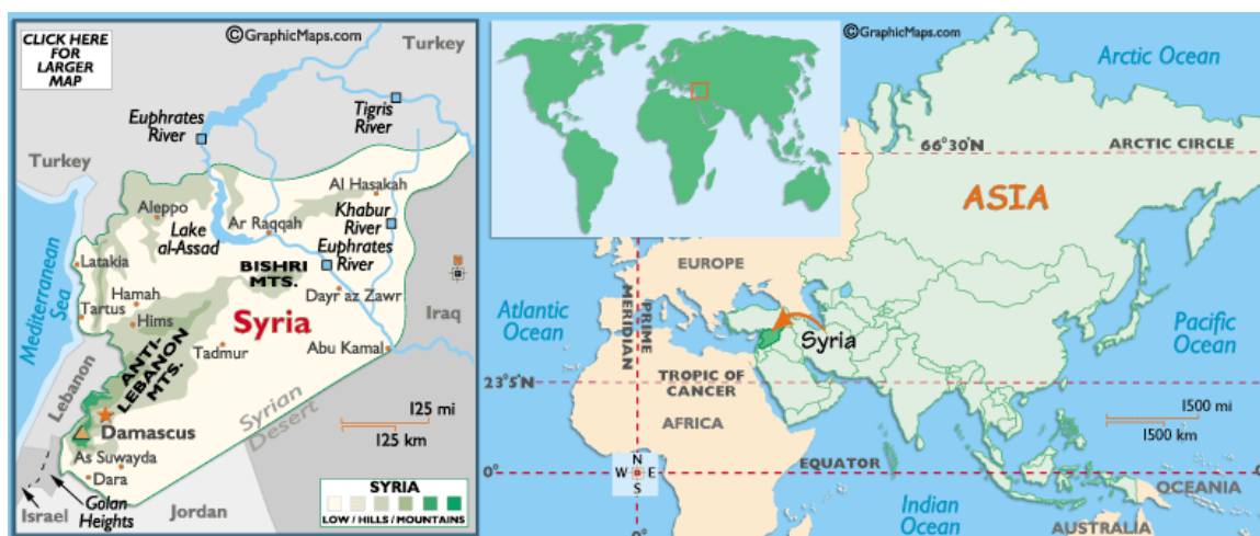
Obrázek č. 8: Mapa Sýrie