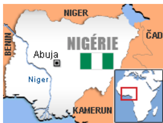
Obrázek č. 11: Mapa Nigérie