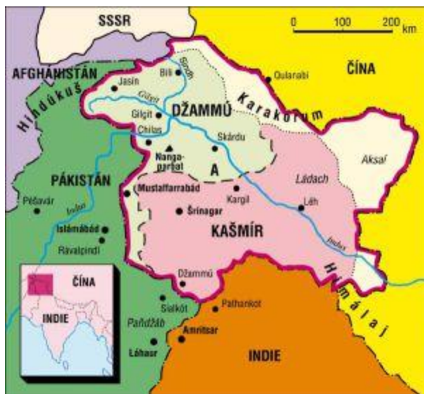
Obrázek č. 12: Mapa kašmíru