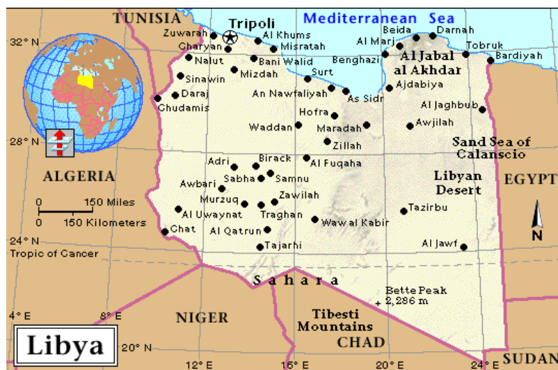
Obrázek č. 2: Mapa Libye