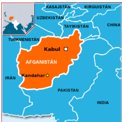
Obrázek č. 5 : Mapa Afghánistánu

Zdroj:< http://intocabledigital.cat/28/la-decisio-india-part-ii/afghanistan/ > [cit. 2012-04-18]