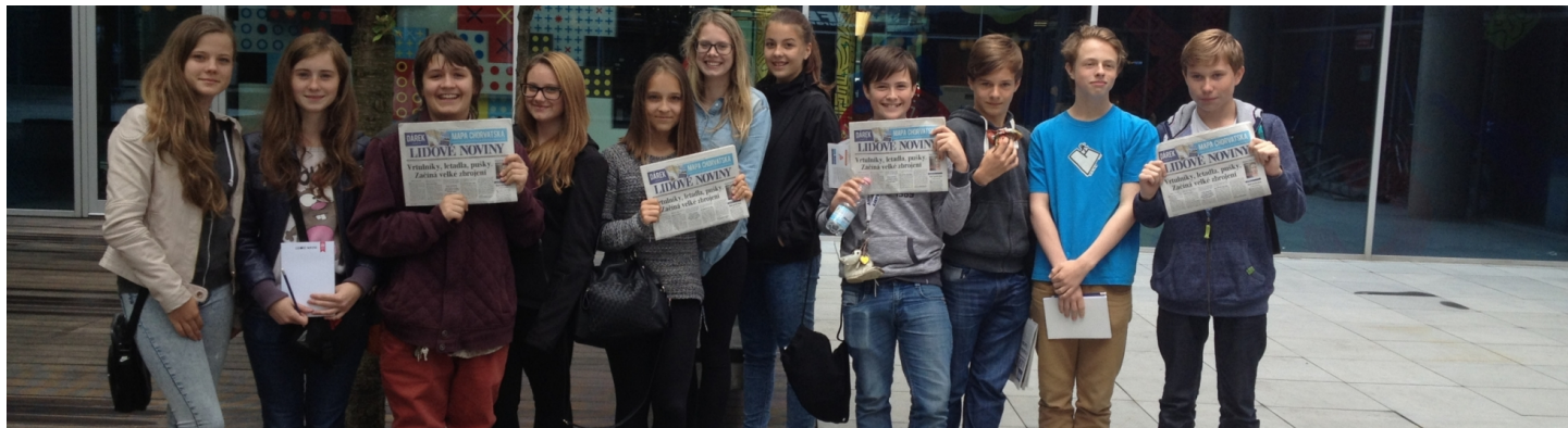
Redakce Čakopisu na exkurzi v Lidových novinách.