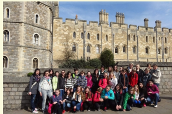
Autor: Mgr. Petra Bogarová

Na výlet do Anglie jsme se vydali autobusem v pondělí večer okolo 19.30 hod. Cesta byla sice dlouhá, ale pohodlná