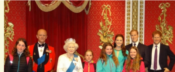
Autor: Mgr. Petra Bogarová

Na výlet do Anglie jsme se vydali autobusem v pondělí večer okolo 19.30 hod. Cesta byla sice dlouhá, ale pohodlná